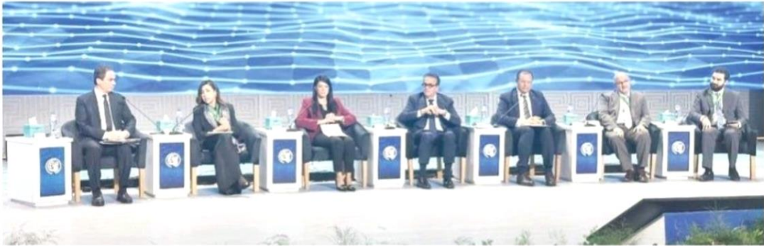
علاء من جلسة مناقشة «التأمين الشامل» في الجمعية الوطنية للصحة بالتعاون مع المجلس الأعلى للصحة والتنمية الصحية

«فريد»: الدولة تدفع اشتراكات ٩٠٥ آلاف من غير القادرين.. ووصول المتعاقدين إلى ٥٢٣ جهة